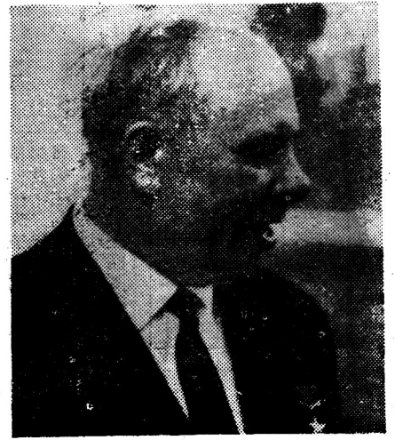
· 尼 格 包 ·

俄共第十九屆代表大會烏克蘭籍中委及候補中委佔全俄共中委及候補中委六·八%。俄共第二十屆增到一五·五%，俄共第二十二屆增到一八·五%，烏克蘭籍之中委及候補中委在俄共中央機關任職者之百分比亦逐年增加。因而包格尼在俄共中央