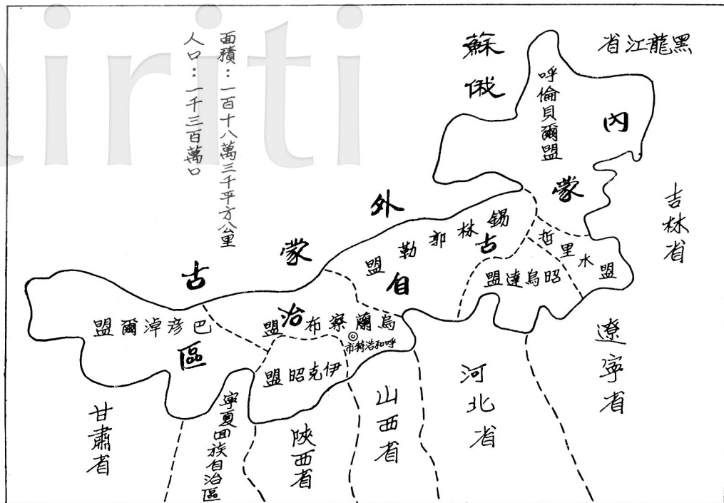
圖略期時盛全區治自古蒙內僞：(一)圖附