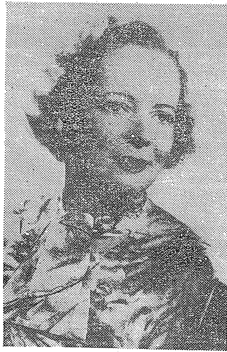
賓賴·珊蘇者作文本

如，該項機構必須負責解答如下的各種問題，如共產主義是否應該像檢疫似的予以隔離？（絕對地使其孤立，或公開予以唾棄。）還是用善意與其接近，使善意的接近帶給共黨份子的損害，較諸我們更大呢？何種具體和詳細的條件，必須列入與共產國家的「交換」計劃下，才能使這種互相交換的訪問、文化、工商業交流等等方式，對於民主國家，較之對克里姆林宮，更為有利呢？ ⑤協助自由世界的各國政府，譬劃他們在國際方面的聯合陣線，使他們遇到與蘇俄發生政治鬥爭時，可以有力地予以還擊，絕不失敗。