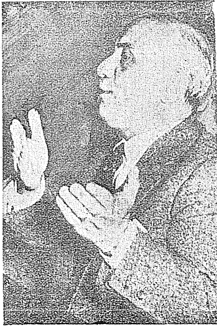
· 尼法范的閣組度再 ·

(三)二次大戰以後，義大利被破壞較輕，恢復秩序較早，馬歇爾計劃提前開始，頓呈一片繁榮景象；但目前發展之結果，並不理想，在拿波里以北地區，工業發達，人民生活水準迅速提高，電視、冰箱無一不備，而南部地區則貧困依舊，西西里百分之八十人民