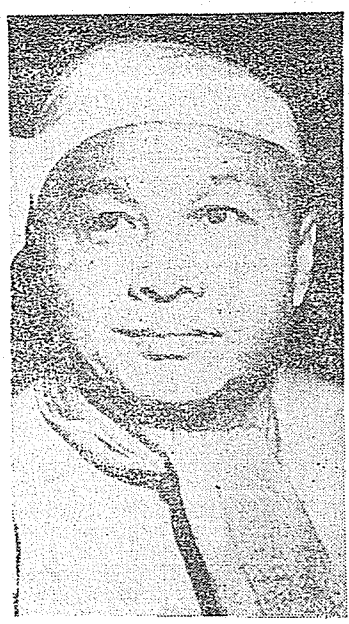
· 努字的翻推被中變政 ·

緬甸獨立以來的第一大政黨是反法西斯人民自由同盟。它成立於一九四四年八月，是當時的緬甸共產黨、人民革命黨（社會黨前身）和翁山將軍領導下的國防軍的聯合組織。其後，緬甸共產黨和其他一些左翼的激烈黨派都相繼退出，剩下以社會黨爲骨幹的一些團體會員和社會人士，一九四八年一月緬甸獨立後，它即擔任組織臨時政府的責任。自此，