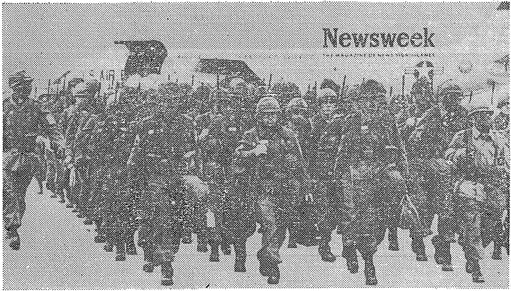
· 形情地基昂波落降隊部頭先，習演運空大歐美行舉軍美 ·

(一) 二次大戰時，由美運一個裝甲師到歐洲需時一個月，以最近運輸情形估計亦需一星期，因之「大空運」之成就實為軍事上一重大進步，大空運之假想敵人是來自東歐的侵略，故同時亦具有政治警告的意味。